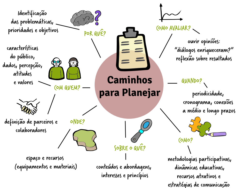
Figura 5 – Aspectos do planejamento de ações de EAN.

Na fase de planejamento é essencial pensar nas pessoas, nas problemáticas, nos processos e no que se espera alcançar com o resultado das ações. Iremos percorrer abaixo alguns caminhos necessários ao planejamento das ações de EAN.