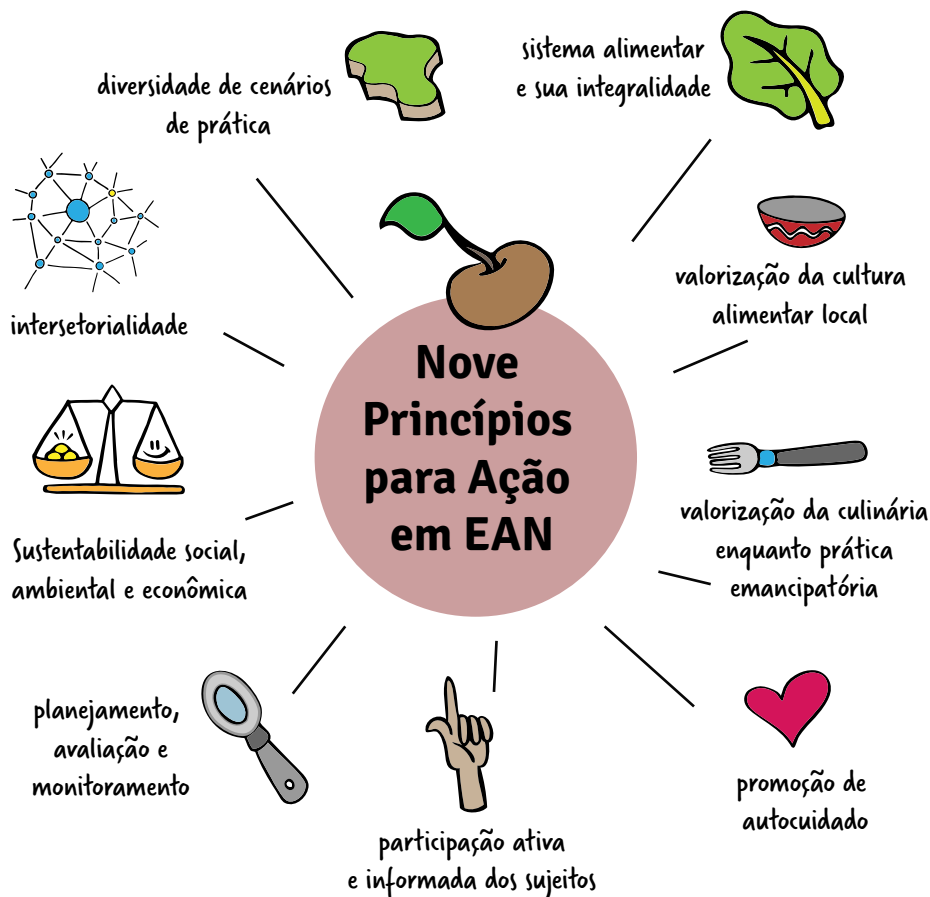
Figura 2 – Os nove princípios para as ações de EAN.

Fonte: adaptado do Marco de Referência em Educação Alimentar e Nutricional para as Políticas Públicas. iv