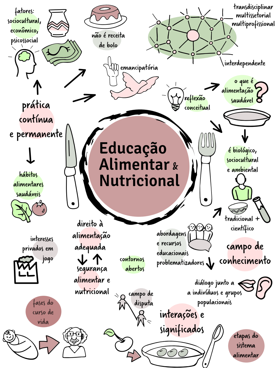
Figura 1 – Representações acerca da conceituação de Educação Alimentar e Nutricional (EAN)