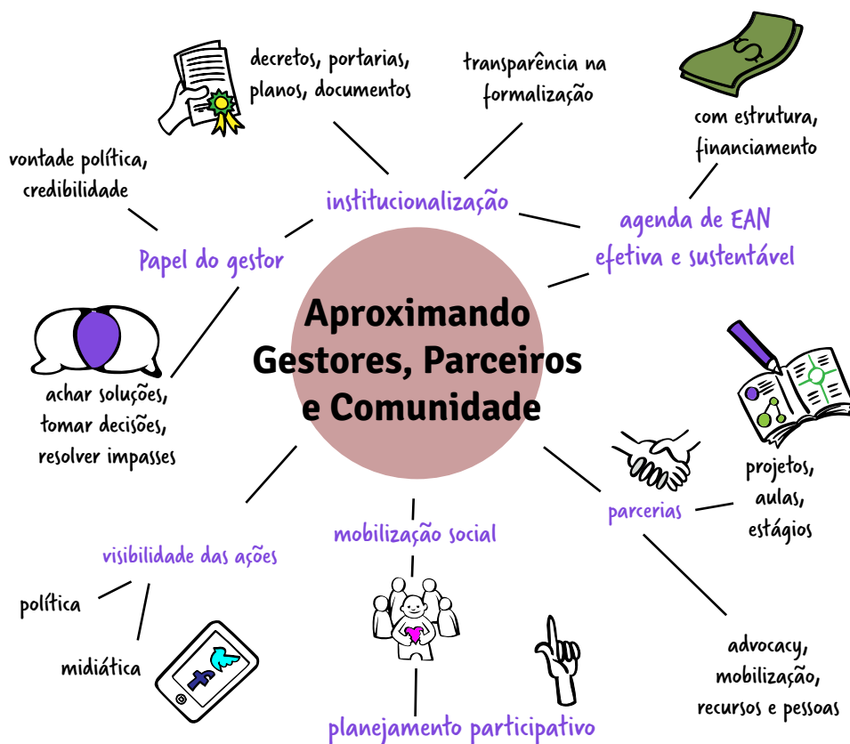
Figura 4 – Aproximando gestores, parceiros e comunidade no contexto da EAN.

A busca de parcerias para um planejamento participativo das ações de EAN permite a soma de esforços, experiências e olhares sobre o território, potencializando ações mais integradas e contextualizadas com a realidade local.