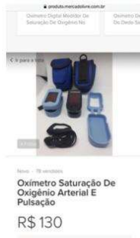
Captura de tela do referido anúncio.

Consulta de mercado realizada na data de 15 de junho de 2020, pela plataforma de vendas on-line “Mercado Livre”, link: https://produto.mercadolivre.com.br/MLB-1410136562-oximetro-saturaco-de-oxignio-arterial-e-pulsaco-_JM