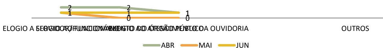
Gráfico 4: Principais Elogios